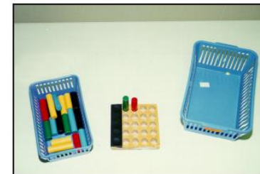
1.1.f Tréstaugar settir í bretti.