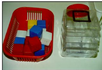
1.1.a Stórir kubbar settir í box.