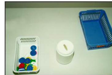
1.1.e Plastskeifur settar í box.